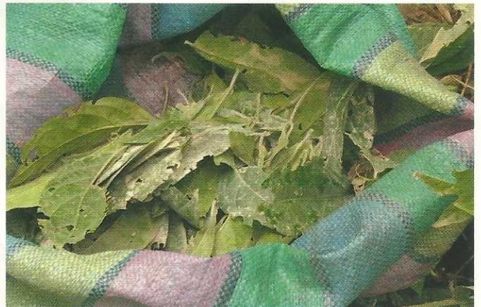
Die gesammelten Chacruna-Blätter, nach vierstündiger Arbeit. Nur die besten davon wandern in den Trank.

Die Substanz könne dabei helfen, sich mit unverarbeiteten traumatischen Ereignissen zu konfrontieren. Wichtig sei dabei der kontrollierte Rahmen der Sitzung. »Die Erfahrung des absoluten Kontrollverlustes in einer sicheren und unterstützenden Umgebung kann es ermöglichen, in vollständigen Kontakt mit